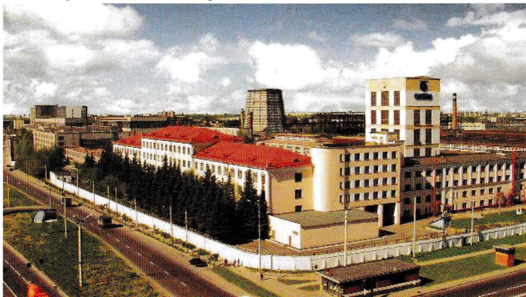
Панорама площадки АО «ОКБМ Африкантов»

Акционерное общество «Опытное Конструкторское Бюро Машиностроения имени И. И. Африкантова» (АО «ОКБМ Африкантов») — одна из ведущих конструкторских организаций Госкорпорации «Росатом», крупный научно-производственный центр атомного машиностроения, располагающий многопрофильным конструкторским коллективом, собственной производственной и экспериментальной базой.